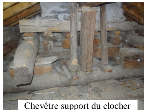
Chevêtre support du clocher