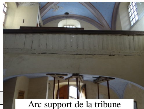
Arc support de la tribune