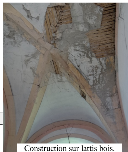
Construction sur lattis bois.