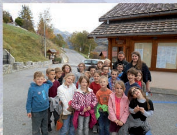
Les élèves de la classe de Stéphanie