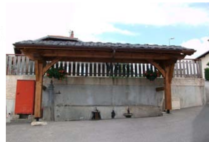
bassin Chef Lieu avant et après travaux