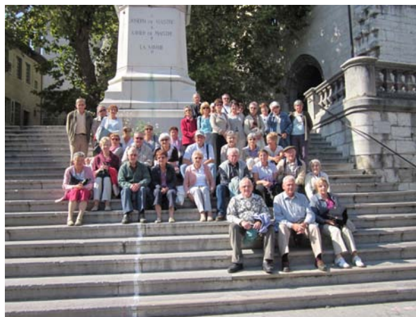
Sortie à Chambéry le 22 septembre 2010