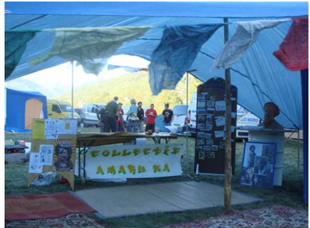
Stand d'information du collectif à l'occasion du "Festoche des llettes" à Hauteville-Gondon le 11 septembre. Au menu : information alternative, expo sur Massoud, espace lounge et des petits plats préparés par nos soins, légumes cuits à la lauze et gratin de courge spaghetti, du potager bien sûr !

Mail : collectif.amaruka@gmail.com - Tel : 04 79 22 90 80 - Blog : http://collectifamaruka.blogspot.com/