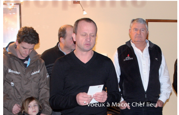
Voeux à Macot Chef lieu

La commune de Macot La Plagne vous souhaite à toutes et tous une très bonne année 2010.