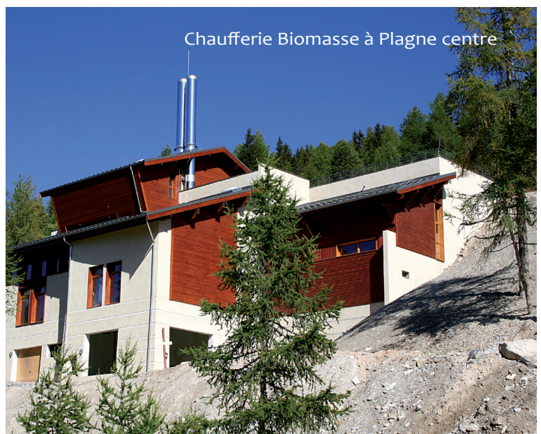
Chaufferie Biomasse à Plagne centre