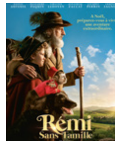
RÉMI SANS FAMILLE 20h30