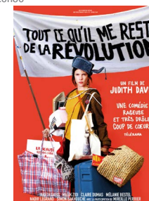
TOUT CE QU'IL ME RESTE DE LA RÉVOLUTION 20h30