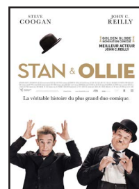
STAN & OLLIE 20h30