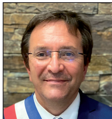
Jean-Luc BOCH Maire de La Plagne Tarentaise