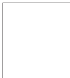
Bertrand Crétier conseiller municipal